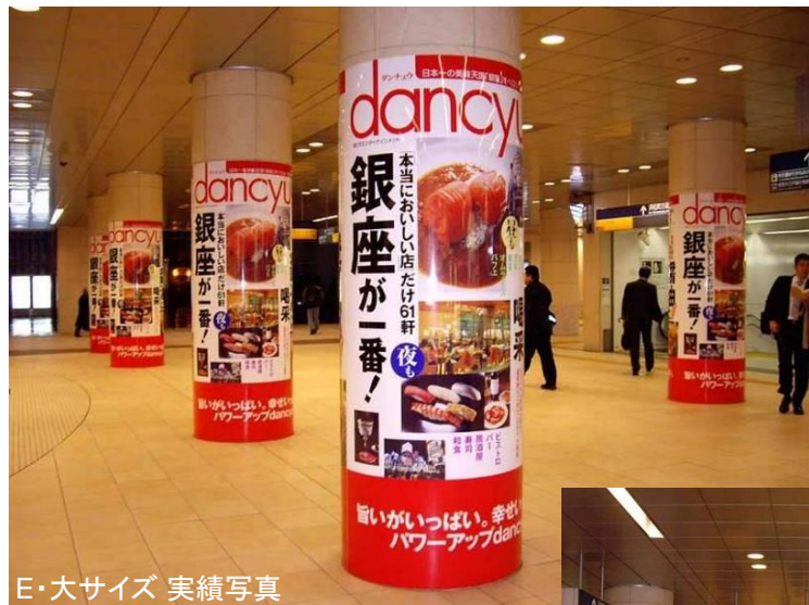
E・大サイズ 実績写真