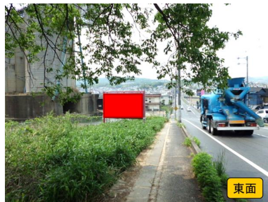
内照型ロードサイン 夜間参考写真