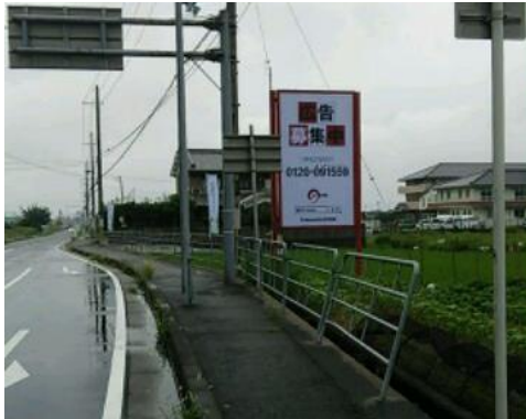
内照型ロードサイン 夜間参考写真

備考 ・ 広告料金のお支払いは、掲載開始日の前日迄の振込支払 ・ 電気代：¥45,000- (税別) / 12ヶ月 ※点灯時間は、日没～23時まで