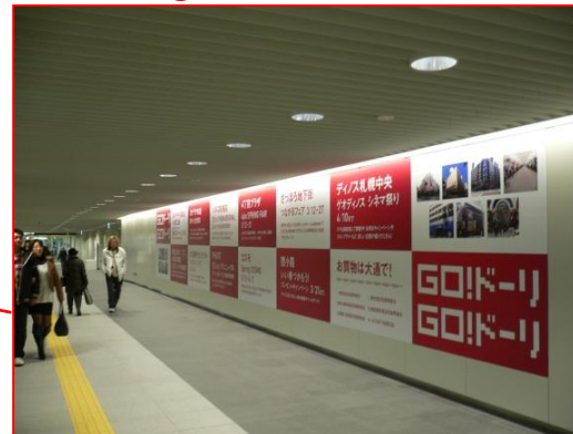
短期枠⑧ ※期間限定2018年11月～2019年10月まで