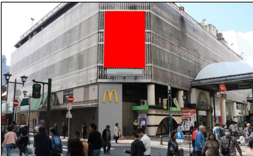
【A】西鉄福岡駅 &amp; 地下鉄天神駅より天神・大名エリアへ