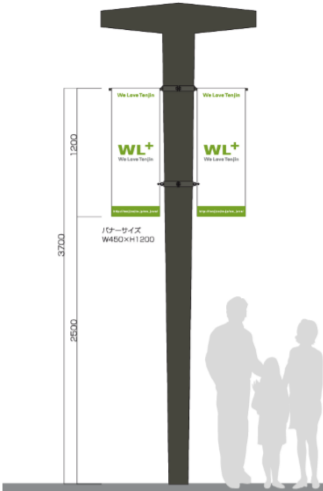
四角形の看板切り取 国体通以北 街路灯