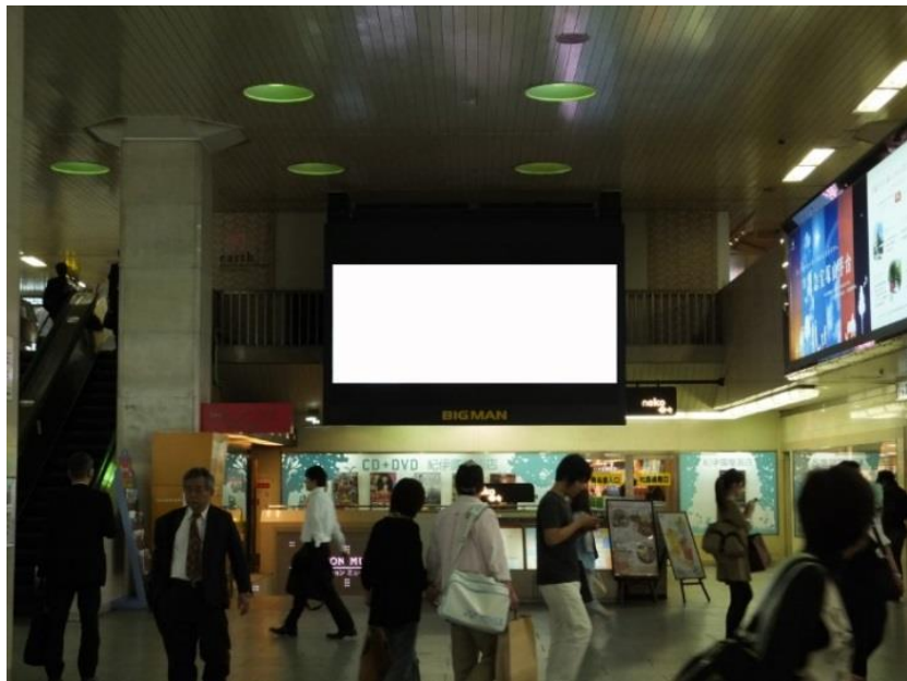
阪急梅田駅(1F)看板設置図

関西でも有数の待ち合わせスポットとして知られている“ビッグマン前”のシンボル。208インチの高輝度LEDパネルから多種多様な情報・映像が発信される注目の媒体です。