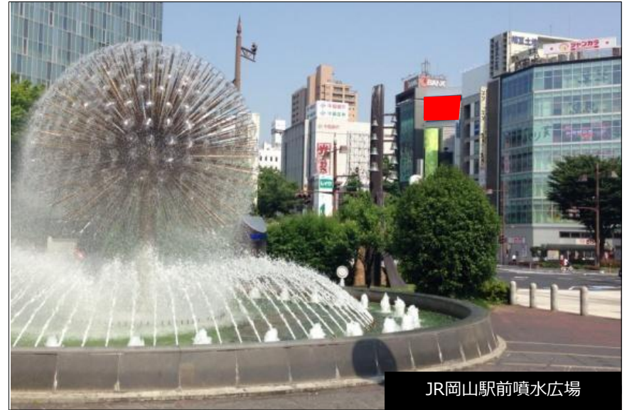
JR岡山駅前噴水広場