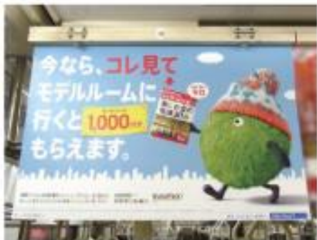
中づくりシングル