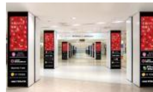
ブルービジョン (JRタワー地下1階 ウェストアベニュー)