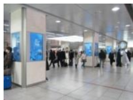
J・ADビジョン Central (名古屋駅イメージ)