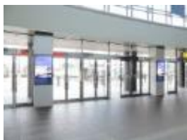
J・ADビジョン 四国 (高松駅イメージ)

表示パネル種類：液晶 / 表示色：フルカラー 音声装置：なし / 入力可能映像ソース：動画 (WMV9) ・静止画 (JPG)