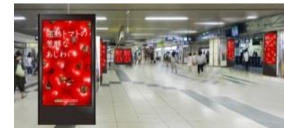
サツエキビジョン (札幌駅 イメージ)