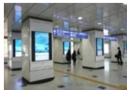
J・ADビジョン WEST (大阪駅イメージ)