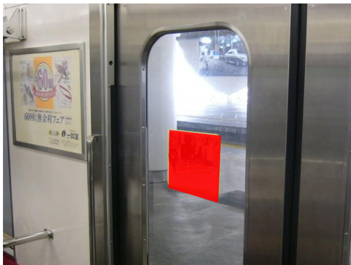
● 各種ステッカー広告掲出位置