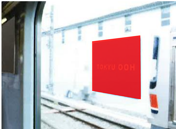
● 各種ステッカー広告掲出位置