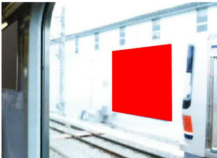
● 各種ステッカー広告掲出位置