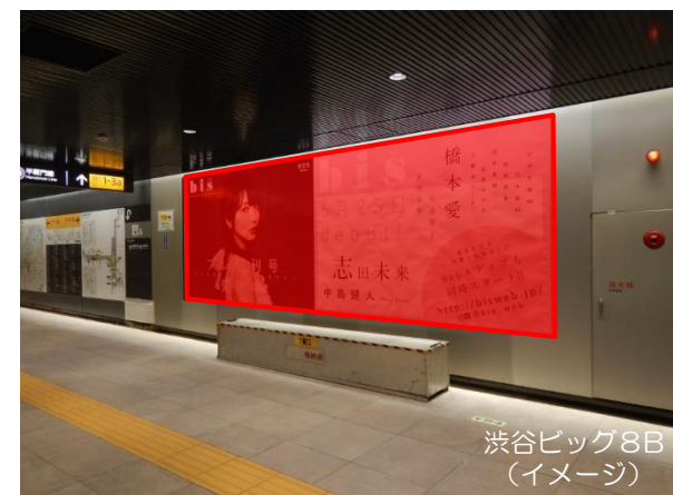
渋谷ビッグ8B (イメージ)