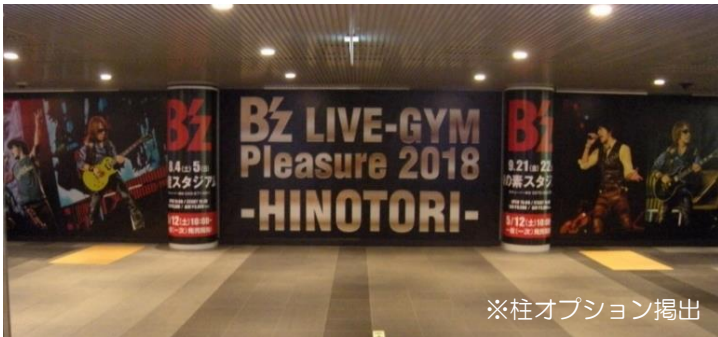
※柱オプション掲出