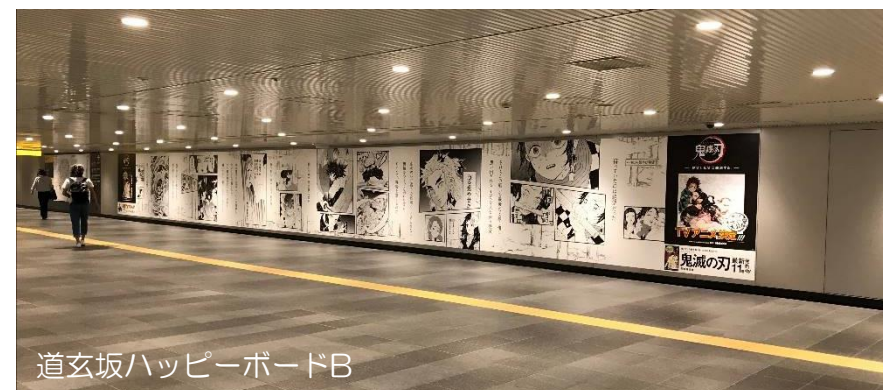
道玄坂ハッピーボードB