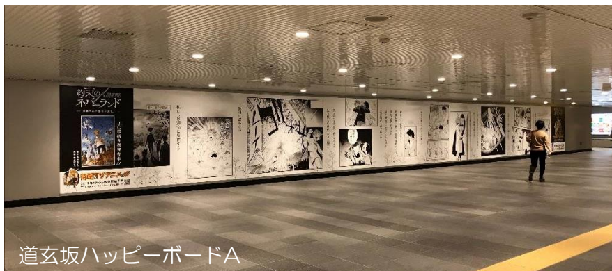
道玄坂ハッピーボードA