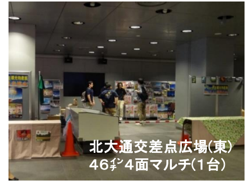
北大通交差点広場(東) 46 \frac{1}{2} 4面マルチ(1台)