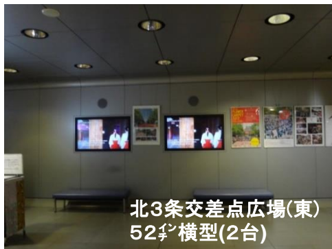
北3条交差点広場(東) 52 \frac{1}{2} 横型(2台)