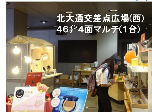
北大通交差点広場(西) 46 \frac{1}{2} 4面マルチ(1台)