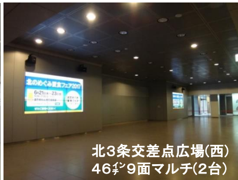
北3条交差点広場(西) 46 \frac{1}{2} 9面マルチ(2台)