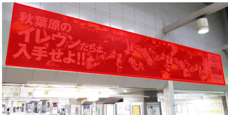
※A・B2面セット (つなげて掲出)